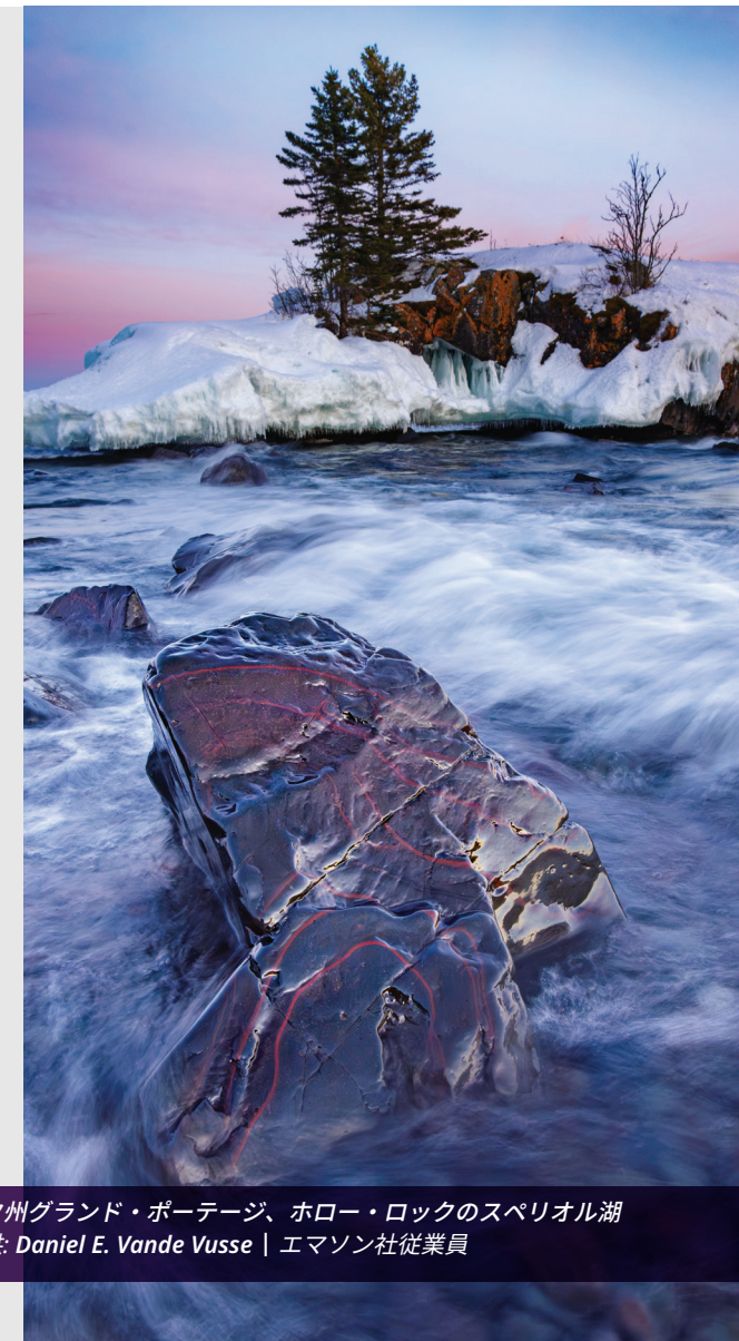
ミネソタ州グランド・ポーツェージ、ホロー・ロックのスペリオール湖

EmersonのOvation™テクノロジーが、2023年2月に安全法認証を取得しました。