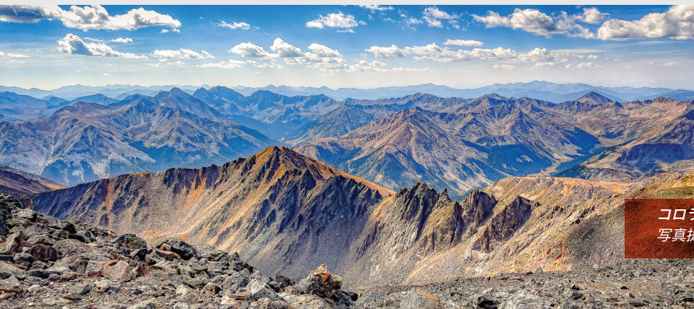
コロラド州グレイズピークからの眺め